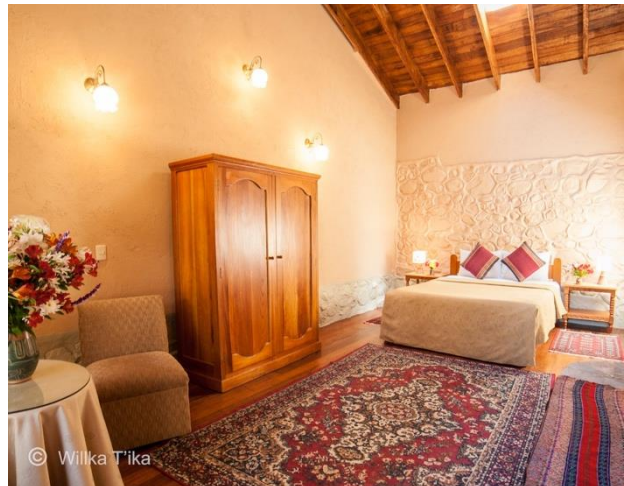
Garden Matrimonial, 4 Rooms $225 / $325 with one queen bed