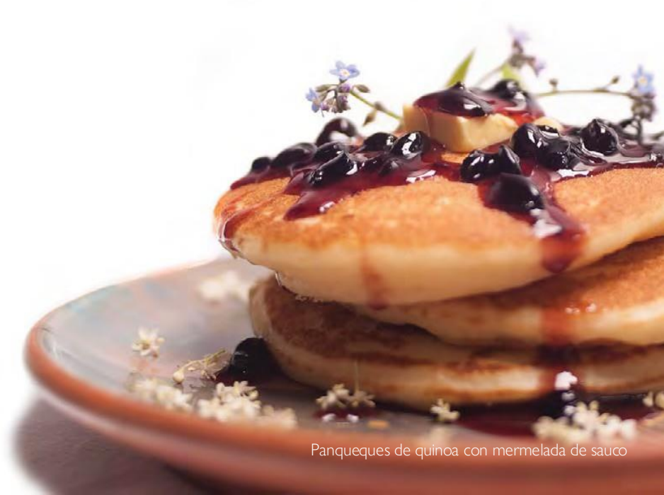
Panqueques de quinoa con mermelada de sauco