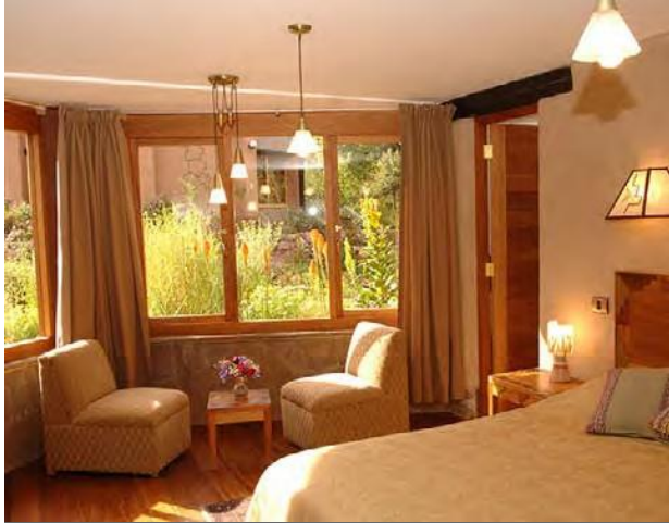
Luxury Single, 3 Rooms $205 / $300 with one king or two queen beds