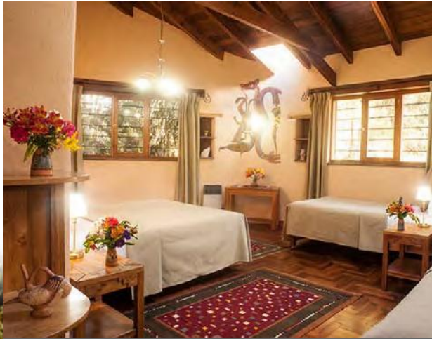
Luxury Triple, 2 Rooms $325 / $450 combination of three beds