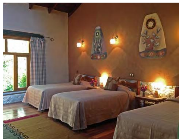
Garden Triple, 4 Rooms $300 / $425 with three twin beds