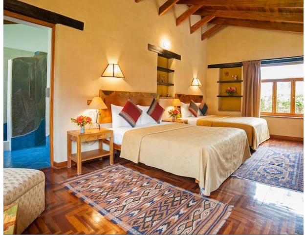
Luxury Twin, 7 Rooms $255 / $375 with two queen beds