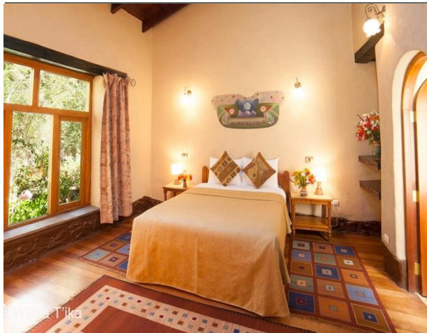
Garden Single, 7 Rooms $155 / $250 with one double or one queen bed

y están estratégicamente ubicadas en zonas de encanto en los jardines. * Como un sitio de retiro de tranquilidad, no dispone televisor, tiene una zona wifi y ofrece un sitio designado para fumar. Las habitaciones tienen calefacción y baños privados modernos. Las flores frescas dan la bienvenida a los huéspedes y bolsas de agua caliente se colocan en las camas en la noche. Si requiere, puede pedir que su habitación esté cerca o con acceso fácil al comedor.