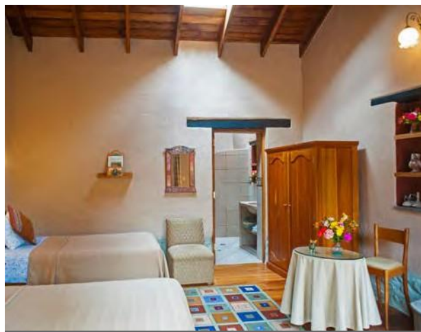
Garden Twin, 3 Rooms $225 / $325 with two twin beds