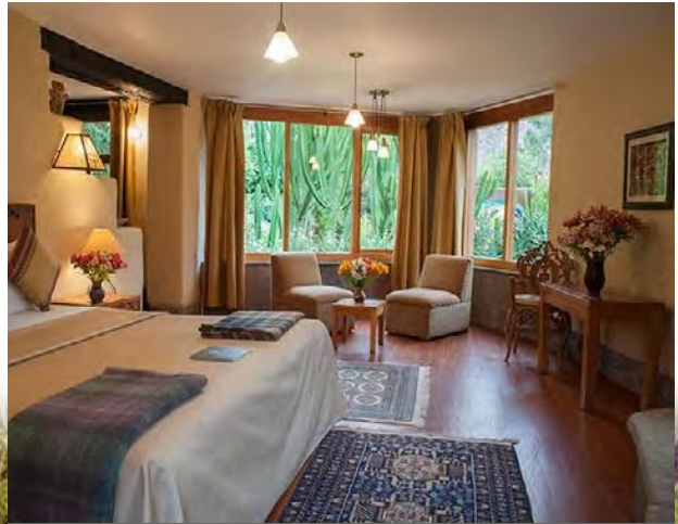
Luxury King, 5 Rooms $255 / $375 with one king bed