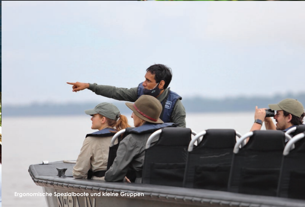
Ergonomische Spezialboote und kleine Gruppen