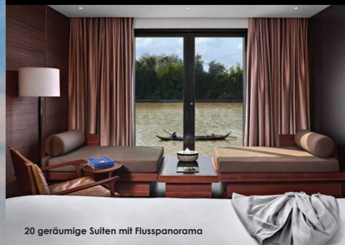
20 geräumige Suiten mit Flusspanorama