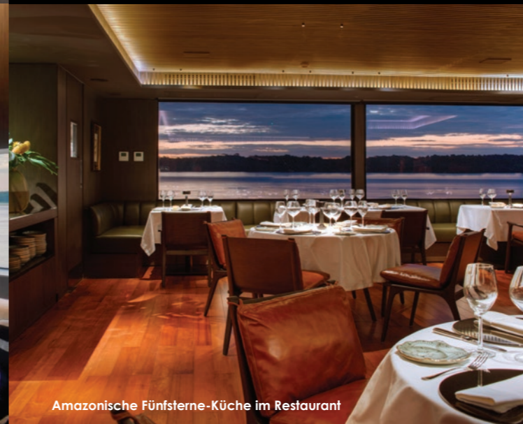
Amazonische Fünfsterne-Küche im Restaurant