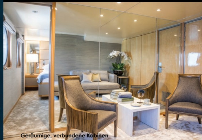
Geräumige, verbundene Kabinen