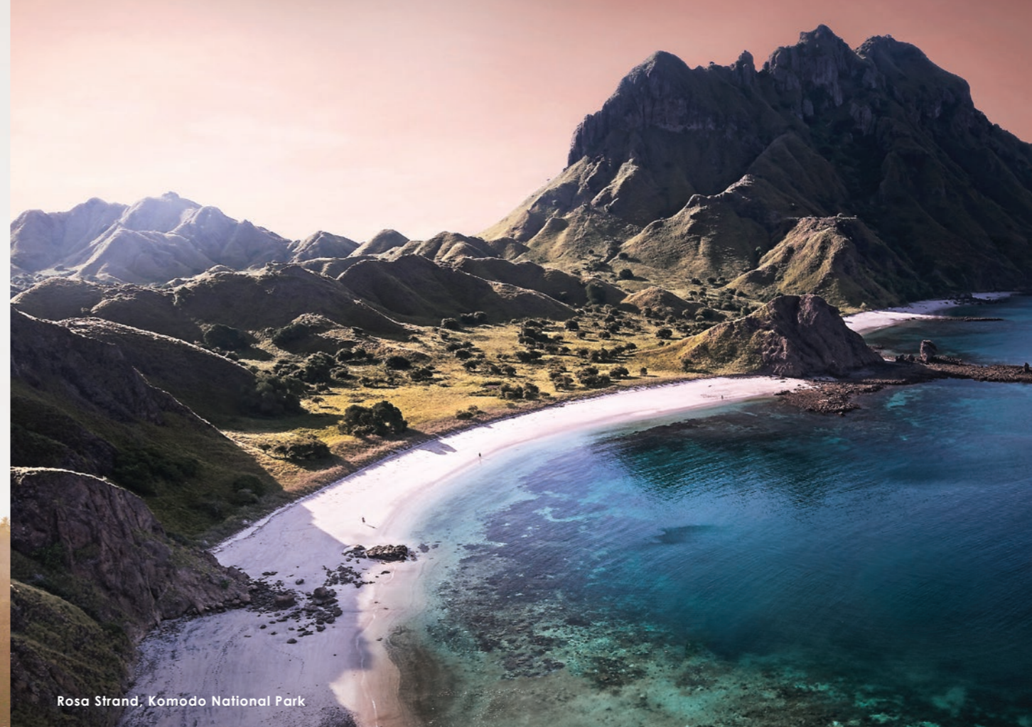
Rosa Strand, Komodo National Park