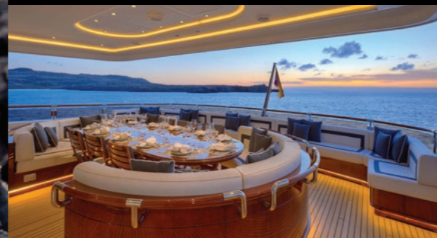
Frisch auf den Tisch: Aqua Mares raffinierte Küche – perfekt, um bei liebevoll zubereiteten Spezialitäten atemberaubende Ausblicke zu genießen.