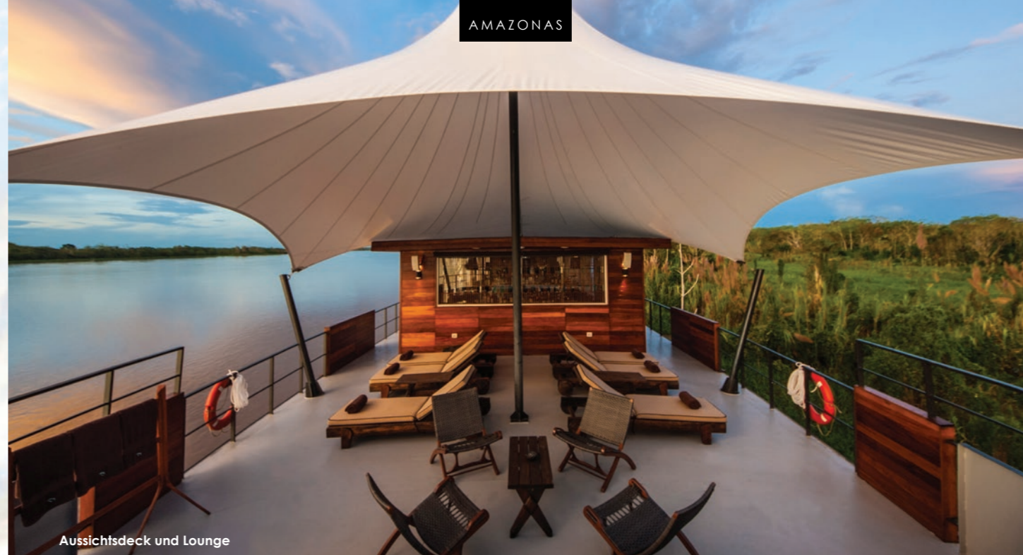
Aussichtsdeck und Lounge