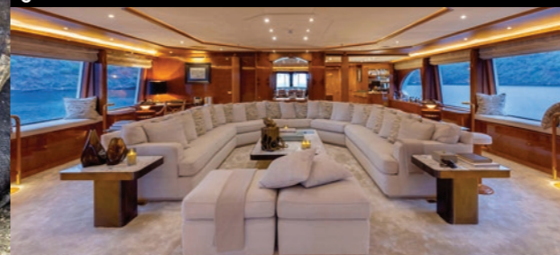
Entspannen Sie in der Panorama-Lounge und teilen Sie ihre fantastischen Erlebnisse mit anderen Gästen.