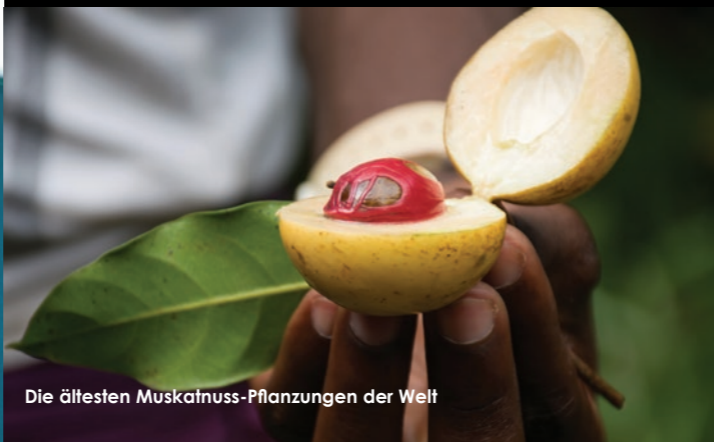
Die ältesten Muskatnuss-Pflanzungen der Welt