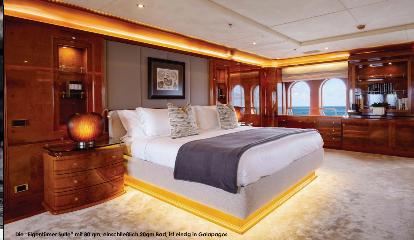
Die "Eigentümer Suite" mit 80 qm, einschließlich 20qm Bad, ist einzig in Galapagos