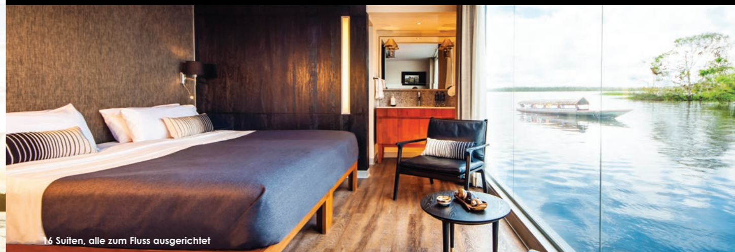
16 Suiten, alle zum Fluss ausgerichtet