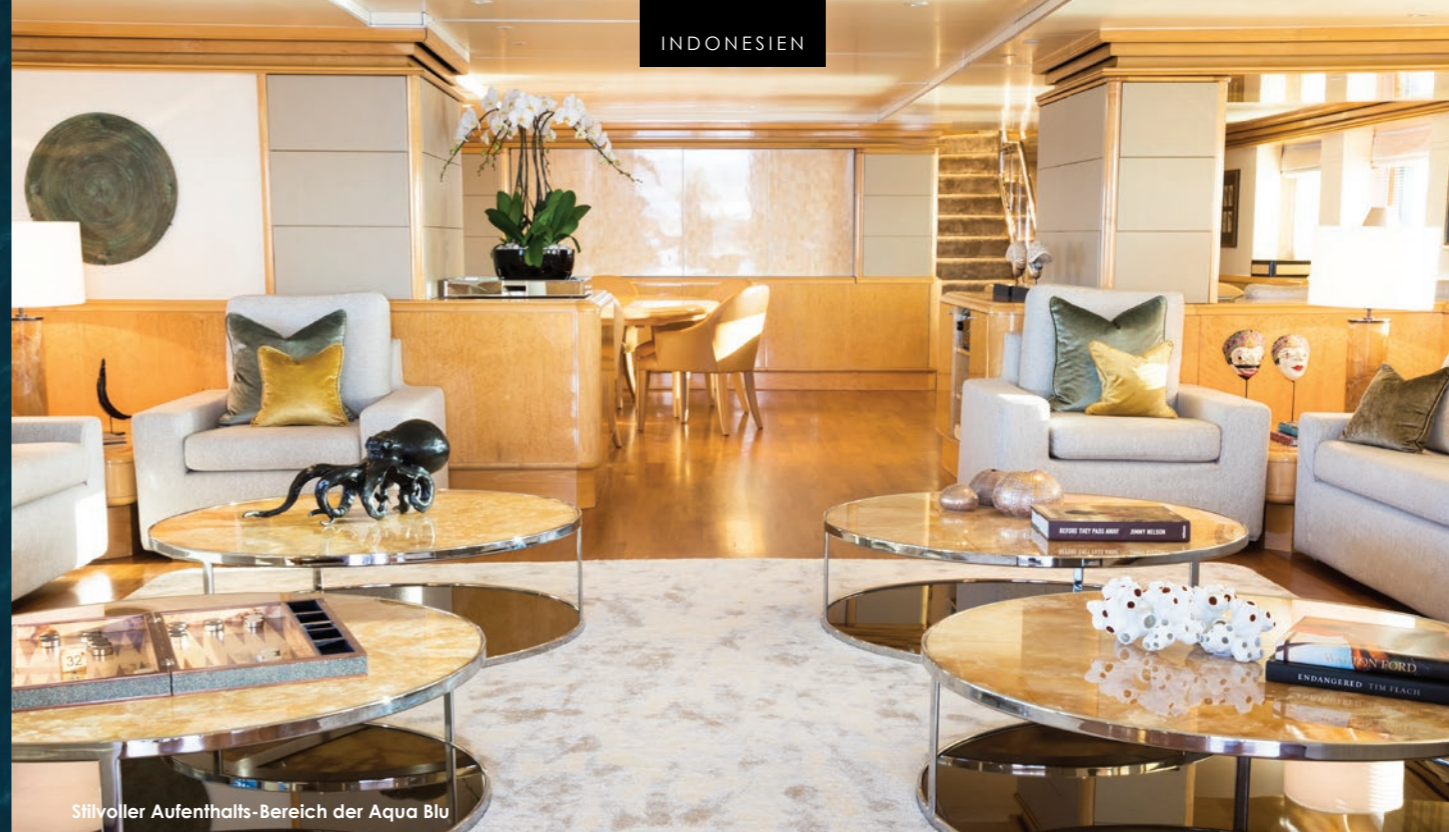
Stilvoller Aufenthalts-Bereich der Aqua Blu