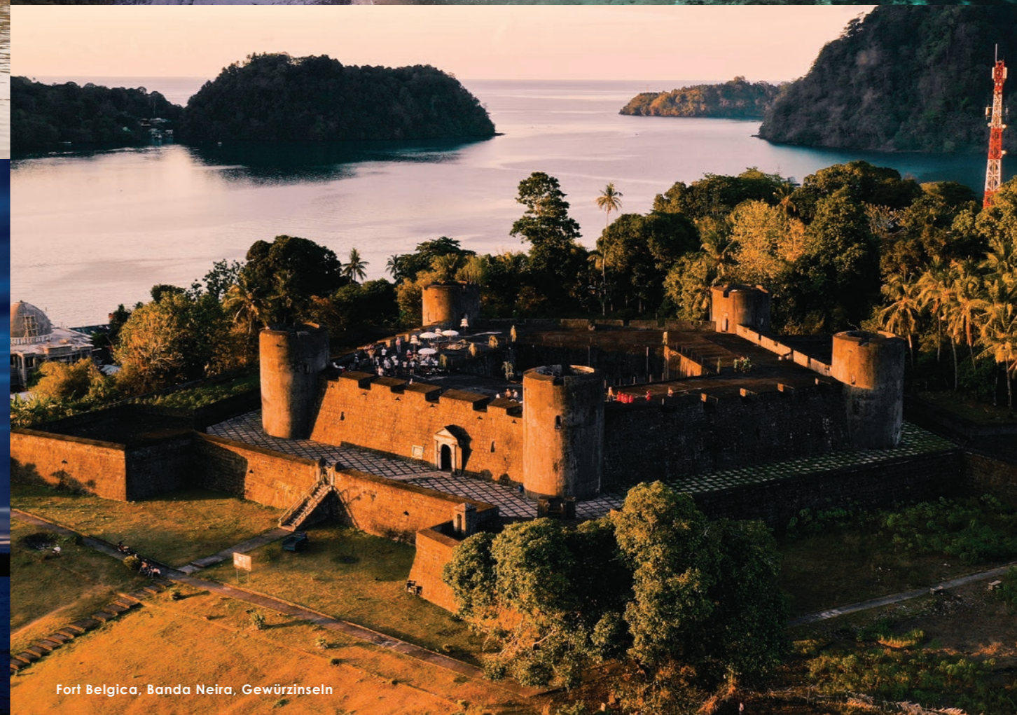
Fort Belgica, Banda Neira, Gewürzinseln