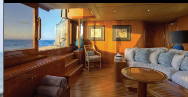
Entspannen Sie auf dem Unterdeck in unserem 'Beach Club' mit Panoramablick