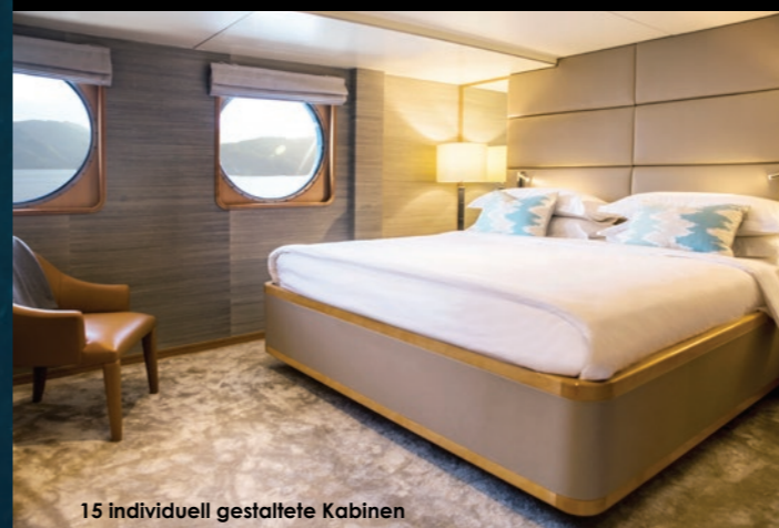
15 individuell gestaltete Kabinen