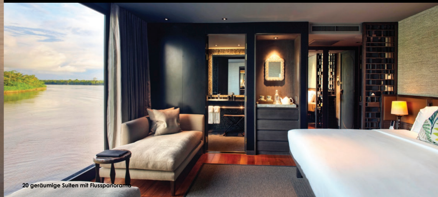
20 geräumige Suiten mit Flusspanorama