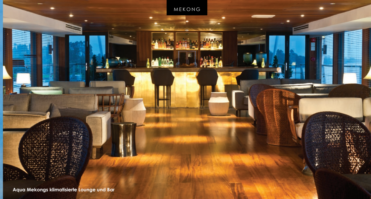
Aqua Mekongs klimatisierte Lounge und Bar