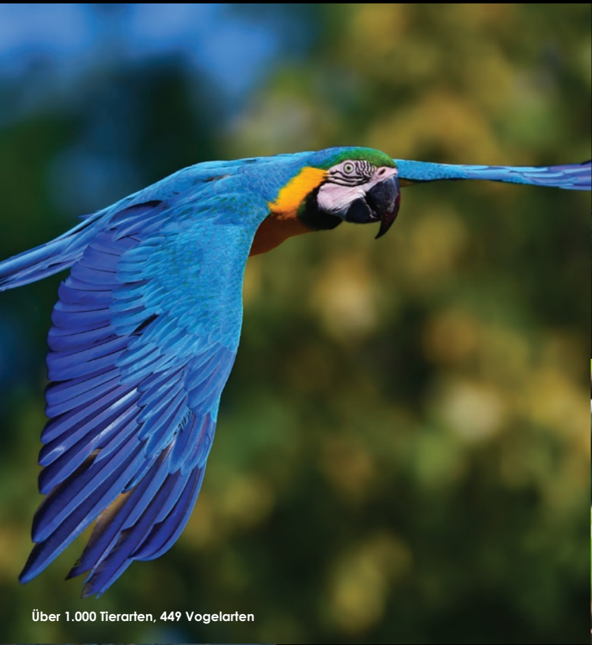
Über 1.000 Tierarten, 449 Vogelarten