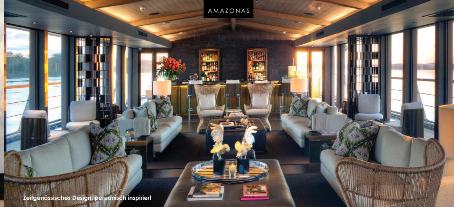
Zeitgenössisches Design, peruanisch inspiriert